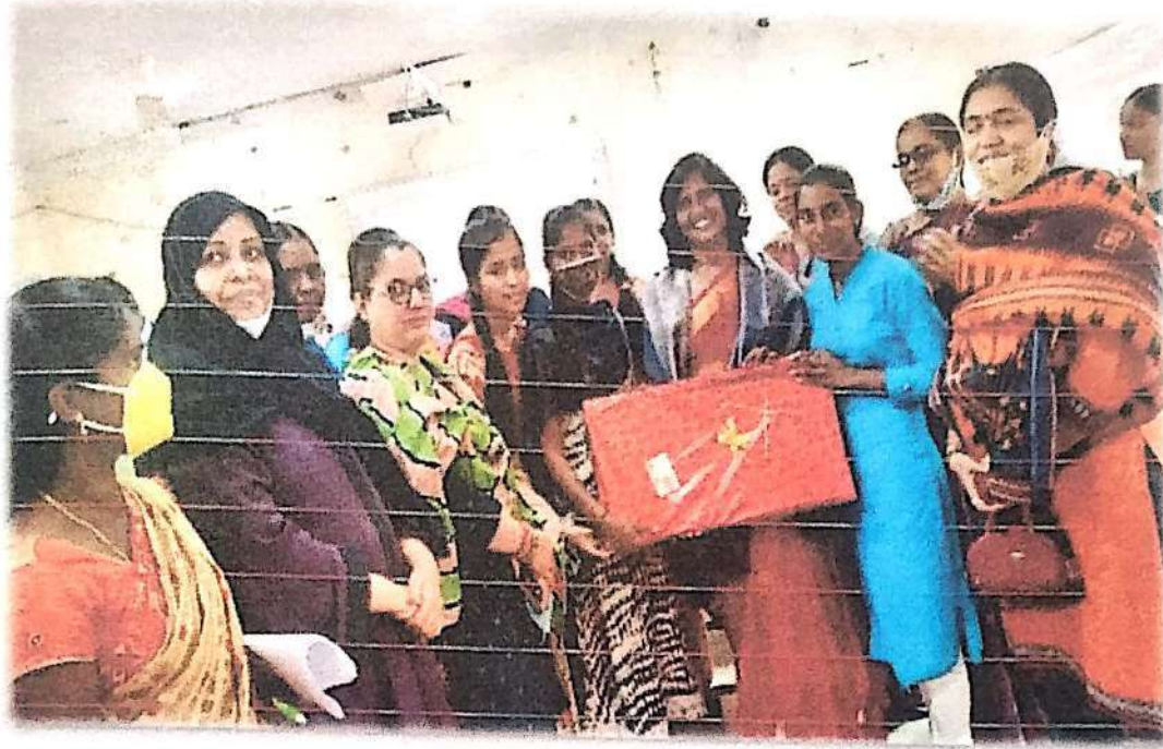
Students and faculty members are felicitating the resource person.