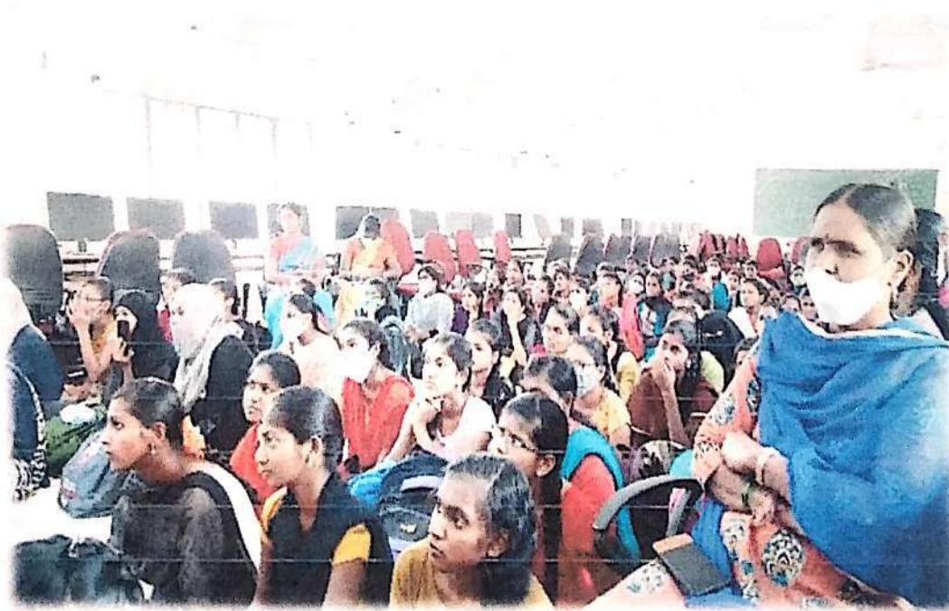
Students and Faculty members of GDC (W), Nalgonda at the awareness programme