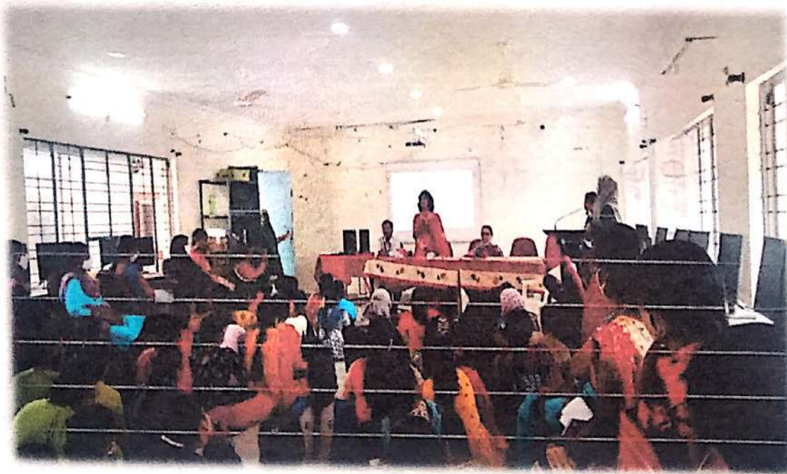
All the students and facty members are listening the words of the resourse person enthusiastically.